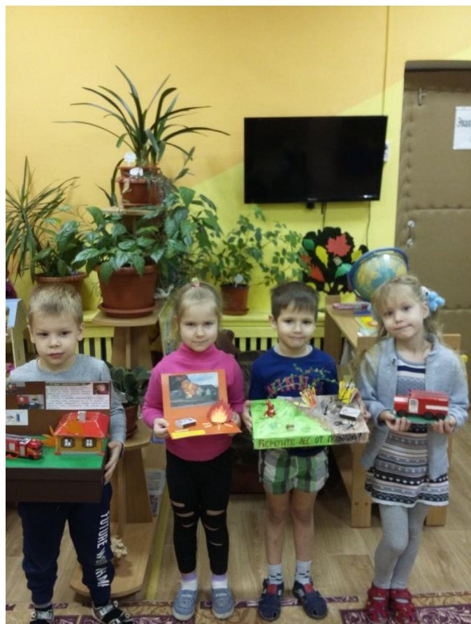
Макеты «Будь осторожен с огнем!»