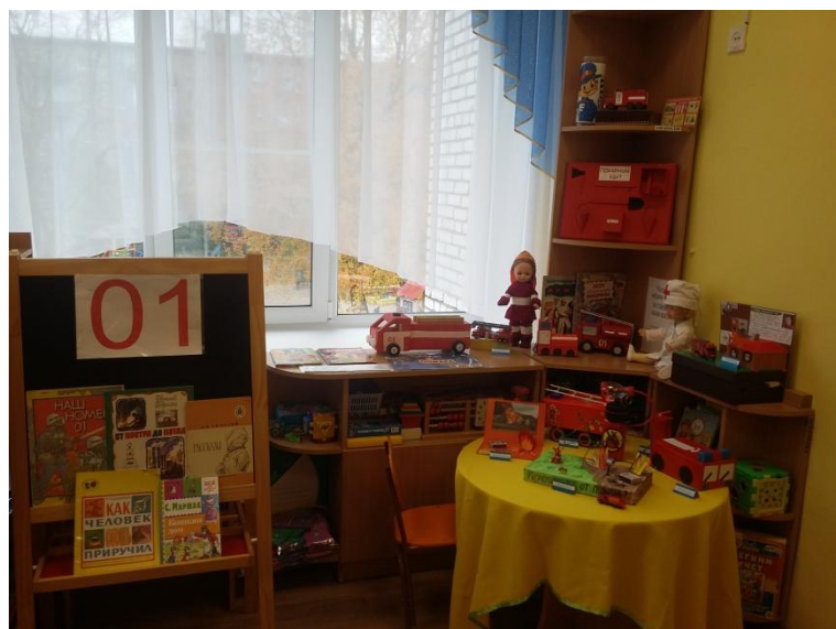
Центр пожарной безопасности