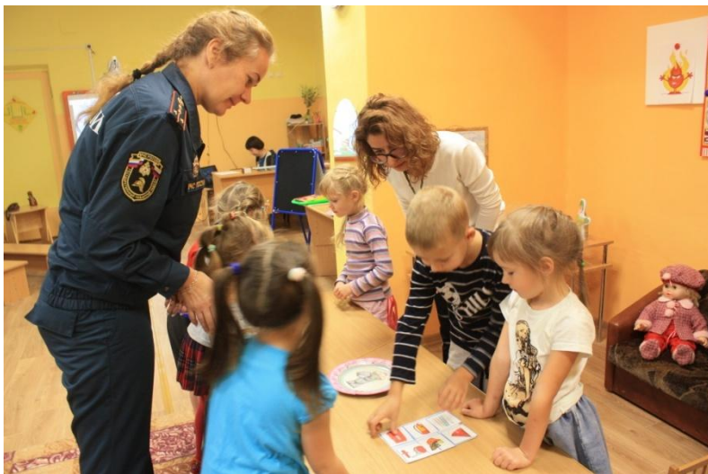
Беседы с приглашением инспектора МЧС