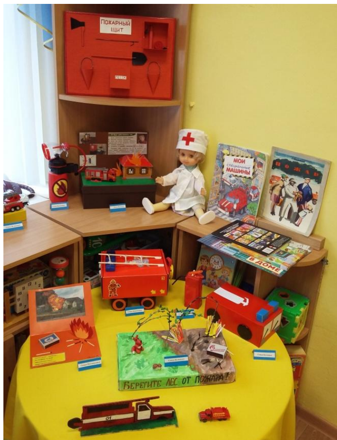
Выставка «Пожарные машины»