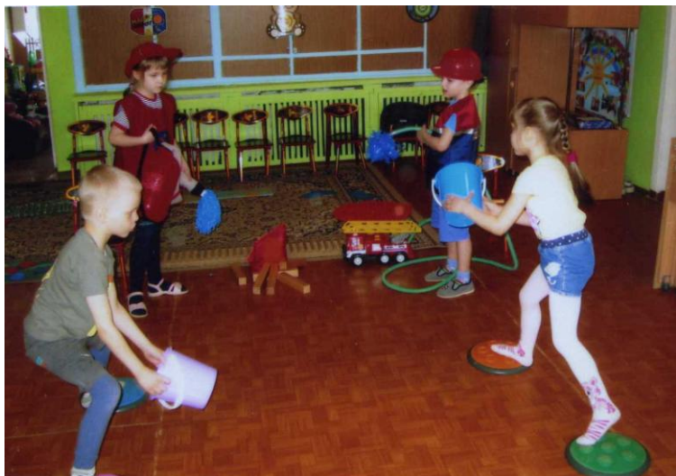
Эстафета «Тушение пожара»