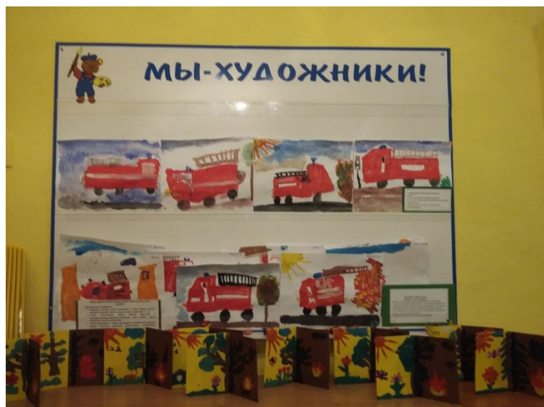
Продуктивная деятельность «Пожарные машины спешат на помощь»