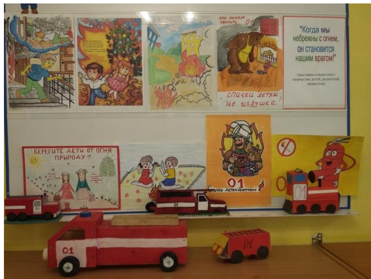
Выставка совместного творчества детей и родителей «Когда мы небрежны с огнем, он становится нашим врагом!»