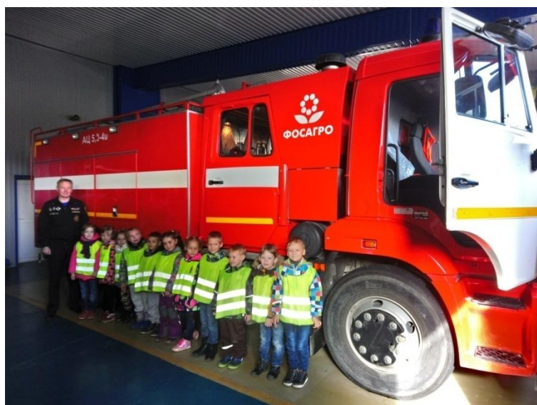
Экскурсия в музей пожарной техники (пожарное депо «ФосАгро» г. Волхов)