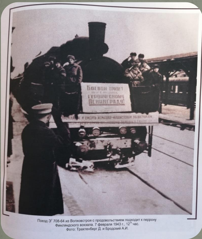
Поезд Э' 708-64 из Волховстроя с продовольствием подходит к перрону Финляндского вокзала. 7 февраля 1943 г., 12 00 час.