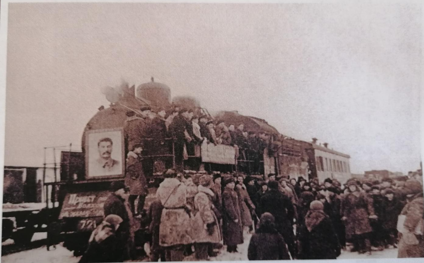
Первый поезд из Ленинграда прибыл на ст. Волховстрой-1.