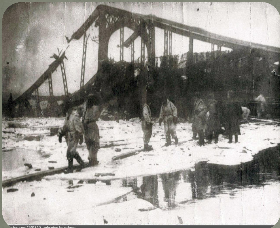
Фото взорванного железнодорожного моста через реку Волхов

istvu.com/230340 uploaded by ncknm 0411.com/330390 фотография раи ирраи