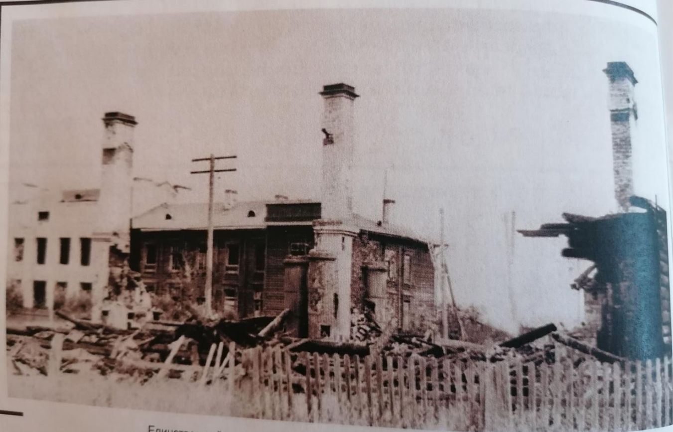
Единственный уцелевший из нескольких домов, сожженных немцами на ст. Волховстрой-1. 1941 г.

Единственный уцелевший из нескольких домов, сожженных немцами на станции Волховстрой