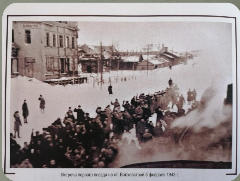
Встреча первого поезда на ст. Волховстрой 8 февраля 1943 г.